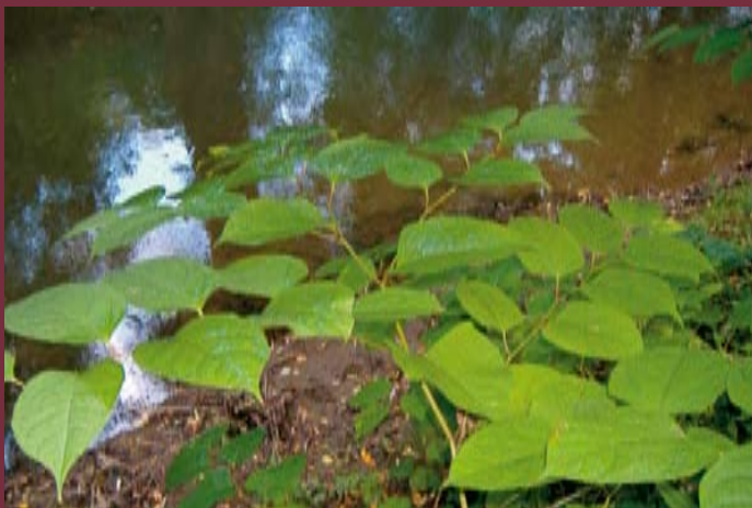
- Křídlatka japonská

Aktivitty projektu jsou směřovány do povodí řeky Morávky, které se nachází ve východní části Moravskoslezského kraje na úpatí Beskyd. Plánované akce se budou dotýkat hned několika chráněných území. Z chráněných území evropského významu se jedná o evropsky významnou lokalitu Niva Morávky, evropsky významnou lokalitu Beskydy a ptačí oblast Beskydy. Dále je to velkoplošné chráněné území chráněná krajinná oblast Beskydy a dvě maloplošná chráněná území: národní přírodní památka Skalická Morávka a přírodní památka Profil Morávky.