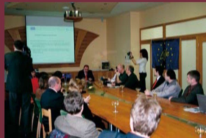
Slavnostní zahájení projektu se uskutečnilo v pivovaru Radegast v Nošovicích.

Plzeňský Prazdroj, a. s. je vedoucí pivovarnickou společností ve střední Evropě a je největším českým exportérem piva. Společnost je součástí globální pivovarnické skupiny SABMiller, a proto ve své činnosti uplatňuje nejpřísnější mezinárodní standardy. Týkájí se především odpovědného přístupu firmy k životnímu prostředí, zaměstnancům a obchodním partnerům. Společnost je certifikována nezávislou mezinárodní autoritou podle standardů ISO 9002 a ISO 14001 a splňuje nejpřísnější normy Evropské unie, pokud jde o zabezpečení nezávadnosti potravin (HACCP) a prevenci znečištění životního prostředí (IPPC).